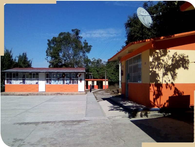
Escuela Primaria "Herminio Salas Gil" CCT 24EPR0145A

Así como a la población objetivo que se busca atender mediante el Programa.