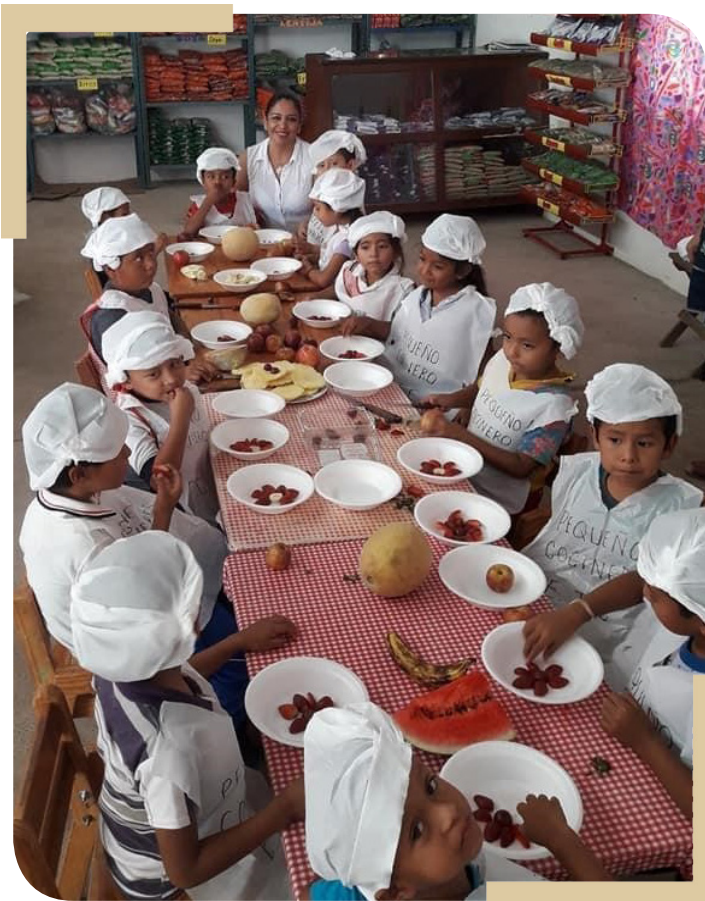
Jardín de Niños "Juan Escutia" CCT 20DJN2153L

El subsidio para el Servicio de Alimentación es un recurso que se otorgará a las ETC que ofrecen este servicio, por lo tanto, las AEL de manera conjunta con el Coordinadora/or Local del Programa y el Coordinadora/or Local del Servicio de Alimentación 9 , en el ámbito de sus respectivas competencias, deberán implementar esquemas eficientes para la operación y funcionamiento del Servicio de Alimentación que se ofrece a todas/os las/os alumnas/os que asisten a una Escuela de Tiempo Completo.