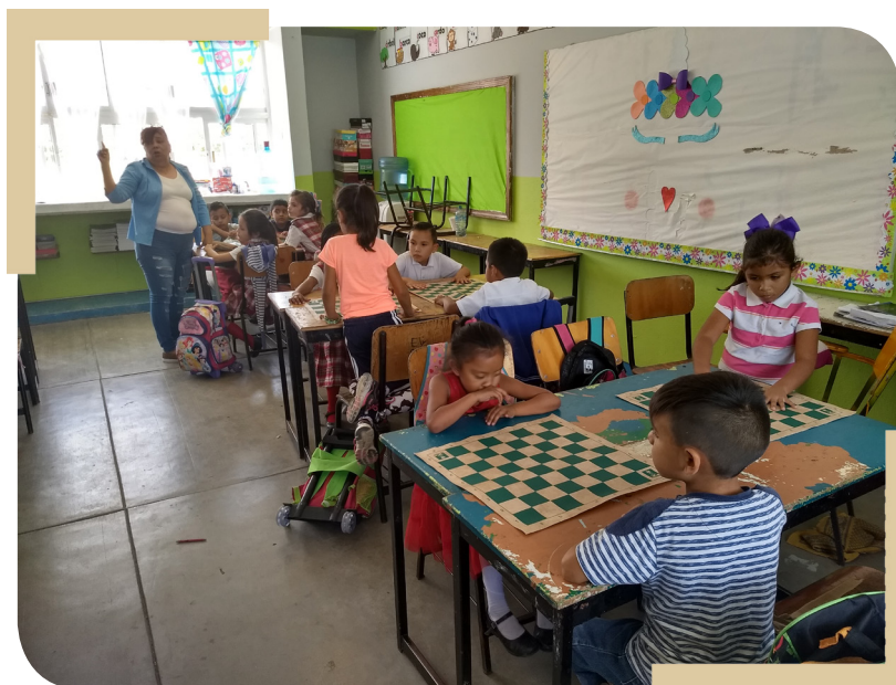
Escuela Primaria "AdolfoLopezMateos" CCT 03DPR0410X

Se podrán incluir todos los anexos que consideren necesarios para justificar y presentar de manera clara su Proyecto .