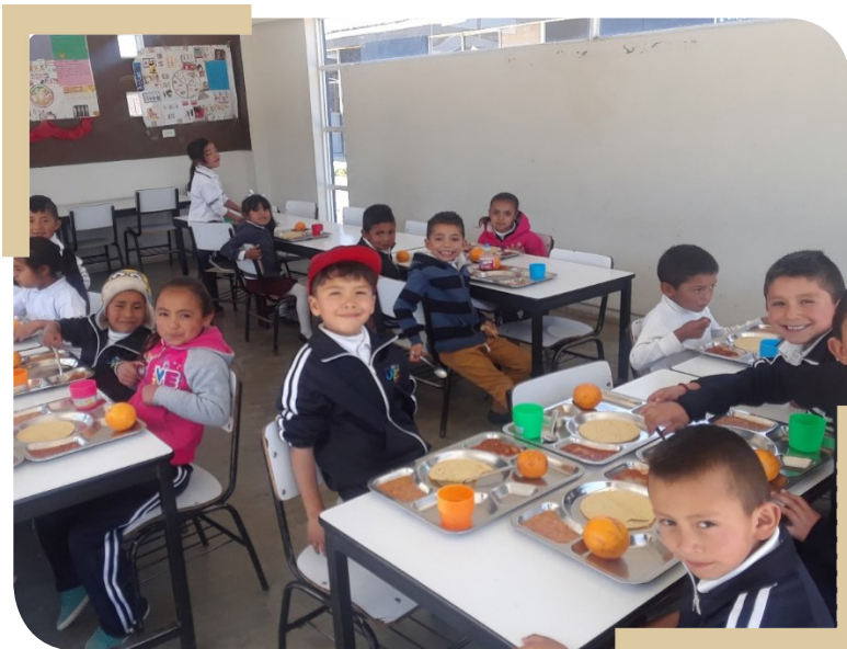
Escuela Primaria "Gral. Francisco Villa" CCT 10DPR0457A