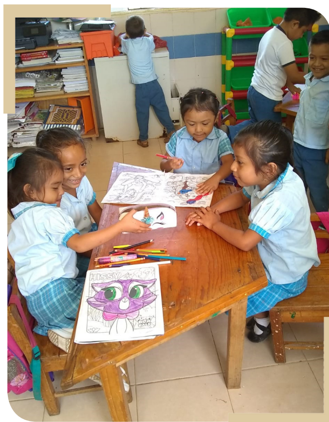
Preescolar "Gustavo Diaz Ordaz" CCT 31DCC0193