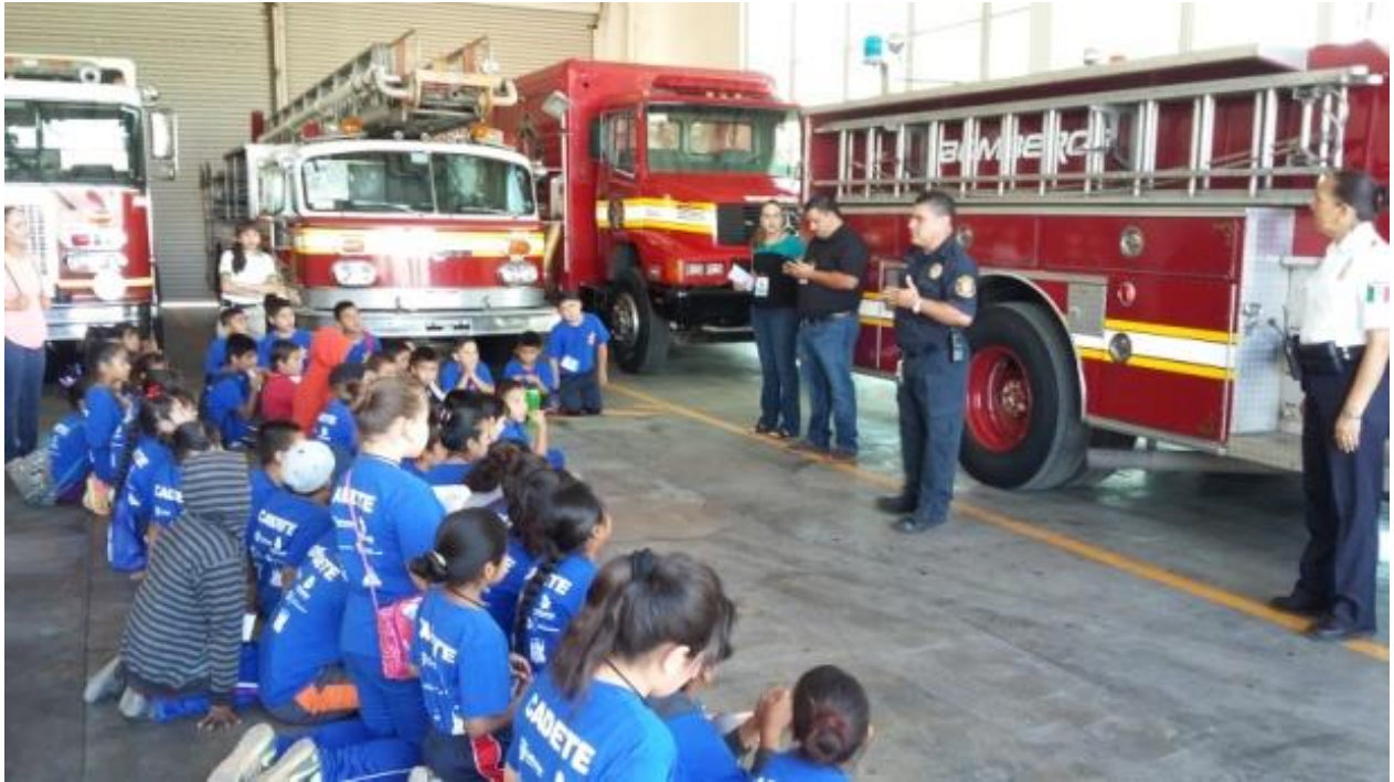
Imagen 6 Visita a la Comandancia de la zona norte