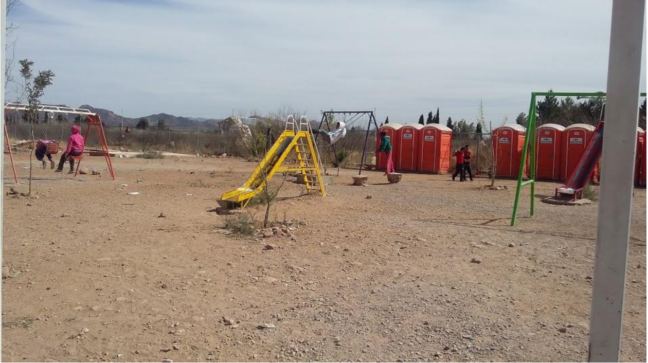
Imagen 2 área de juegos y sanitarios portátiles