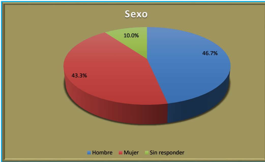
Gráfica 1 Porcentajes del sexo del alumnado