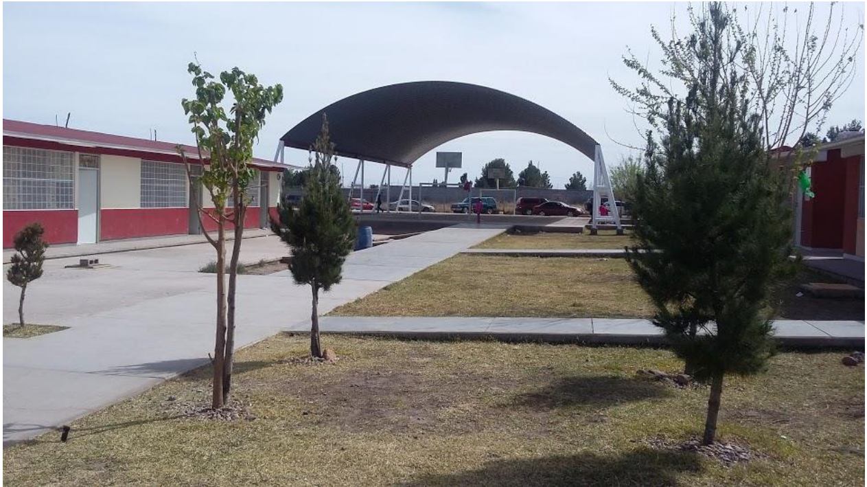
Imagen 1 Área de estacionamiento, cancha y áreas verdes