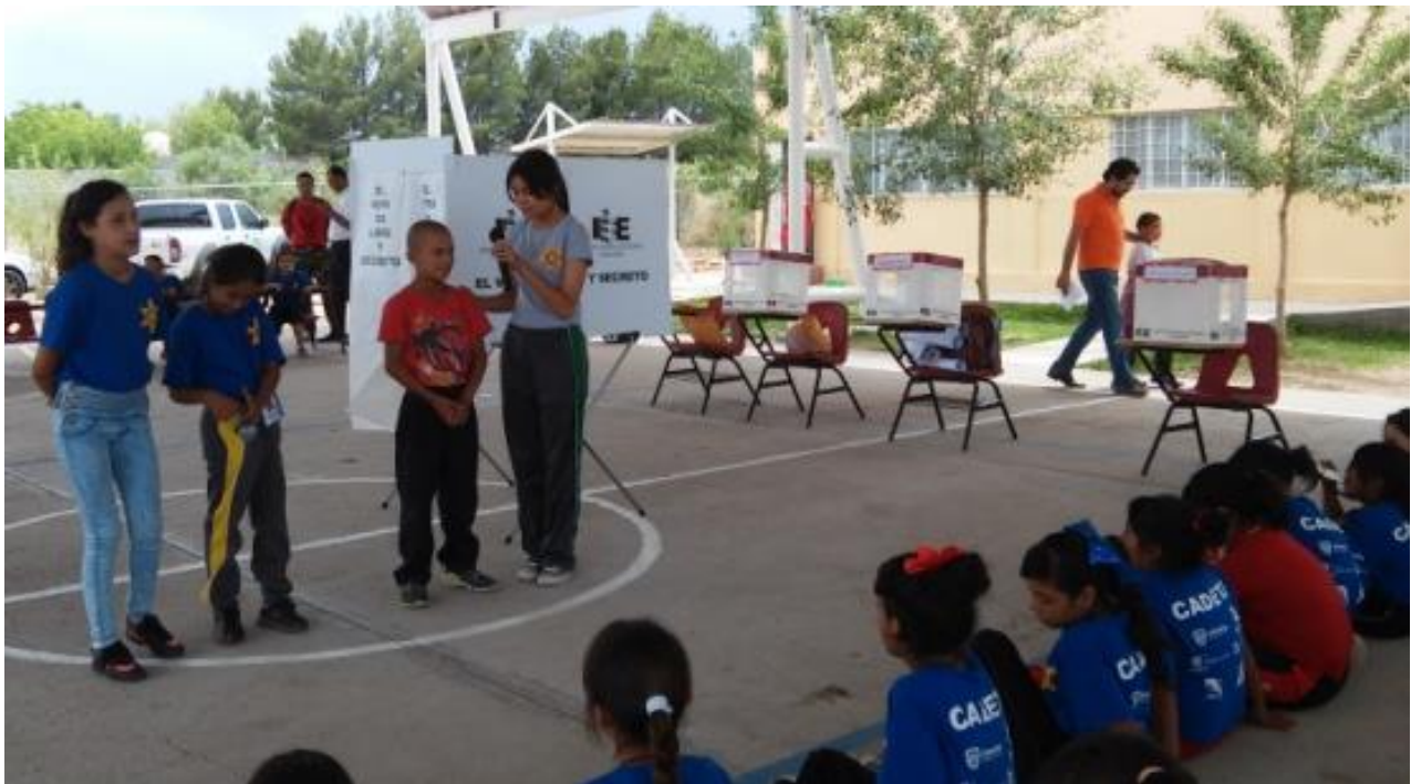
Imagen 7 Presentación de candidatos en el tema de la democracia