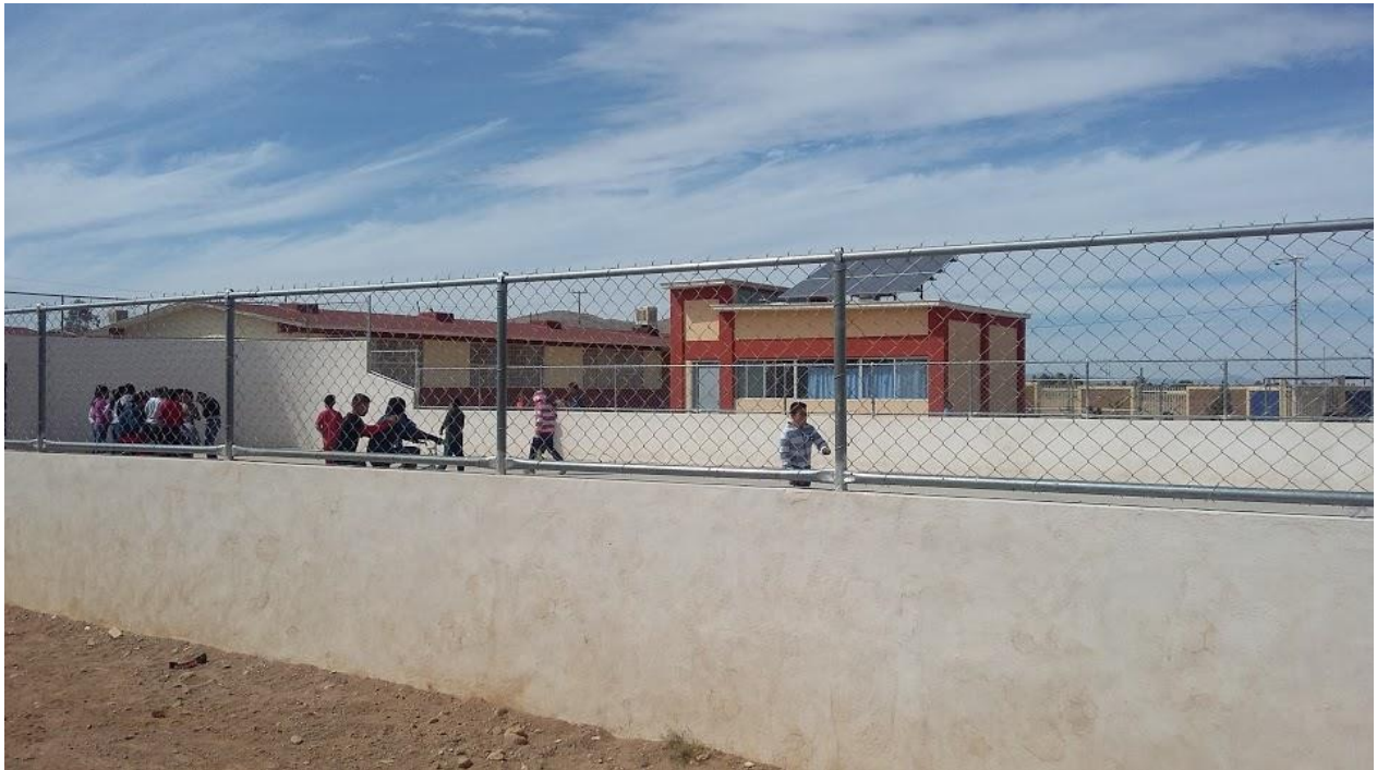
Imagen 3 Cancha al aire libre y aula con celda solar