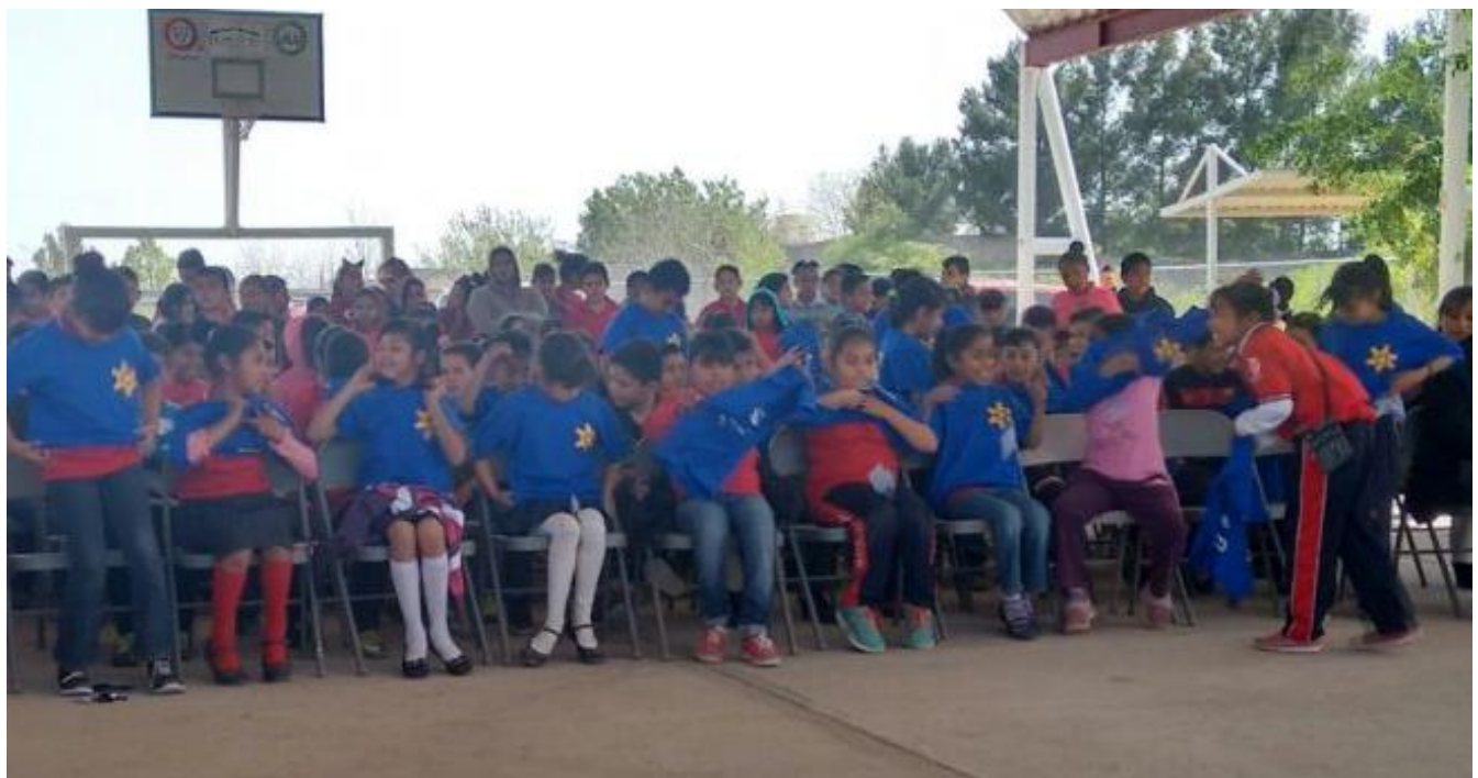
Imagen 5 Alumnos poniéndose la camiseta en la Inauguración de la Academia de la Cultura de la Legalidad