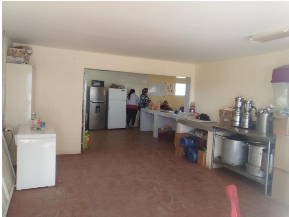
Imagen 4 Área de cocina y comedor